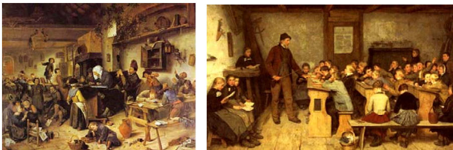
Jan Steen, Dorfschule , 1670; Albert Anker, Dorfschule von 1848; 1896

Schulgebäude sind stets Spiegelbilder der gesellschaftlichen Entwicklung. Ein berühmtes Bild des holländischen Malers Jan Steen aus dem Jahr 1670 zeigt eine Szene aus einer Dorfschule: Manche Kinder schlafen, andere stehen auf dem Tisch und halten Reden, nur einige wenige sind mit „Lernen“ im üblichen Sinn befasst. Der Lehrer selbst, in der Bildmitte mit seiner Frau dargestellt, lehnt sich entspannt zurück. Man könnte das Bild als sarkastischen Kommentar auf die Schule der Zeit interpretieren, aber es ist wahrscheinlich ein realistisches Bild der damaligen Unterrichtspraxis. Dafür spricht, dass ähnliche Schulräume auch in anderen zeitgenössischen Darstellungen vorkommen, nicht zuletzt in Jan Comenius „Orbis Sensualium Pictus“ aus dem Jahr 1658: Ein großer Raum mit Arbeitstischen und einer „Home-base“ des Lehrers im Zentrum.