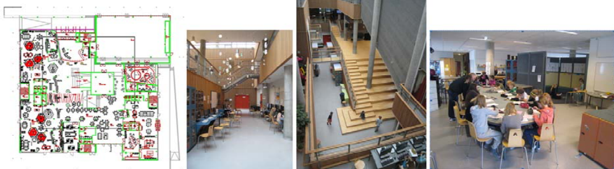
Hellerup-Skole, Kopenhagen/Gentofte, 200

Schon in den 1960er Jahren war man sich bewusst, dass es nicht nur neue Objekte, sondern auch um neue Prozesse in der Planung brauchen würde, um im Bildungssystem zu einer Innovation zu kommen. So verlangten die Autoren eines Texts im Jahr 1967 „dauernden Dialog zwischen Erziehungsfachleuten, Behörden, Politikern, Architekten, Ingenieuren und allen Personen, die sich mit Schulbauproblemen befassen, sowie Erfahrungsaustausch über jene Schulen, die bereits unter Berücksichtigung jener Tendenzen gebaut wurden.“ 8 Dass LehrerInnen oder gar SchülerInnen hier nicht vorkommen, weist auf eine beschränkte Vorstellung von Dialog hin. Aber selbst für diesen beschränkten Dialog und Erfahrungsaustausch waren die Behörden nicht vorbereitet. Planung wurde als streng rationaler Prozess betrachtet, der mit der Analyse eines Bedarfs beginnt und zu einem klar definierten Programm führt, das den Architekten zur Umsetzung übergeben werden kann. Rückkopplung mit den Nutzern galt dabei als unnötige Ablenkung und in vielen Fällen war der direkte Kontakt zwischen Nutzern und Architekten explizit untersagt, eine Praxis.