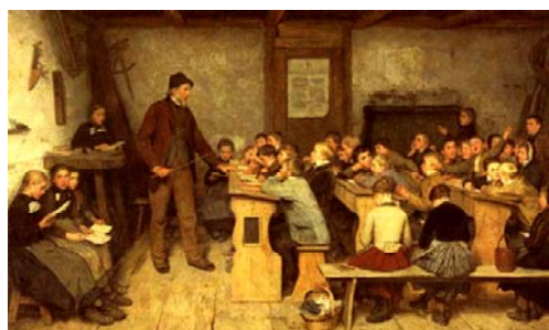
Jan Steen, Dorfschule , 1670; Albert Anker, Dorfschule von 1848; 1896

Ein völlig anderes Bild zeigt Albert Ankers „Dorfschule in 1848“, Ende des 19. Jahrhunderts entstanden. Es gibt nun Bankreihen, auf denen allerdings nur die Knaben Platz finden, während die Mädchen an den Rand gedrängt sind. Der Lehrer ist mit einem Rohrstock bewaffnet, mit dem er sich zumindest in den ersten beiden Reihen Respekt verschaffen kann. Wandtafel gibt es noch keine, da sie erst um 1800 in Schottland im Klassenzimmer eingeführt wurde und sich in Kontinentaleuropa noch etablieren musste. Dieser Klassenraum ist zu einem großen Teil ein Produkt der industriellen Revolution, die die europäischen Gesellschaften zur Mitte des 19. Jahrhunderts radikal verändert hatte. Auch wenn die Idee der allgemeinen Bildung humanistische Wurzeln hatte, so war sie in der Praxis vor allem darauf ausgerichtet, Menschen für das Funktionieren in der Industriegesellschaft und als verlässliche und produktive Mitarbeiter heranzubilden.