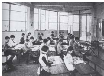
Jan Duiker, Freiraumschule , Amsterdam, NL, 1927

So modern die Schulen, die im frühen 20. Jahrhundert entstanden, oft auf den ersten Blick erscheinen - wie etwa die berühmte Freiluftschule von Jan Duiker in den Niederlanden – so wenig hat sich im Klassenraum selbst geändert. Er wirkt zwar luftiger und heller, Knaben und Mädchen haben wieder die gleichen Bedingungen. Aber es handelt sich nach wie vor um